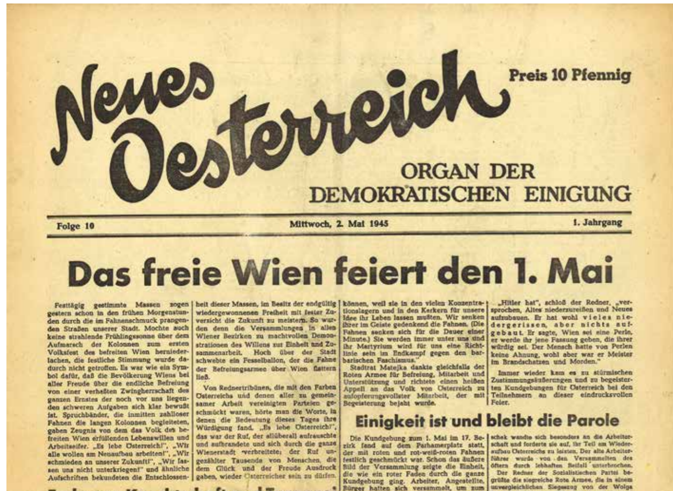
Ausgabe der Zeitung „Neues Österreich“ vom 2. Mai 1945

(Die Zeitung wurde von SPÖ, ÖVP und KPÖ ab dem 23. April 1945 gemeinsam herausgegeben)