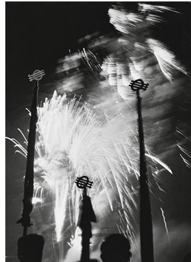
Wien 1. Mai 1951