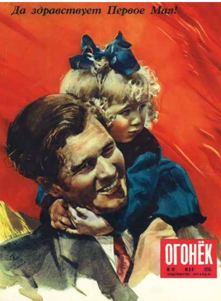
Maiausgabe der sowjetischen Zeitschrift „Ogonjek“ (dt. „Kleines Feuer“) „Es lebe der Erste Mai!“