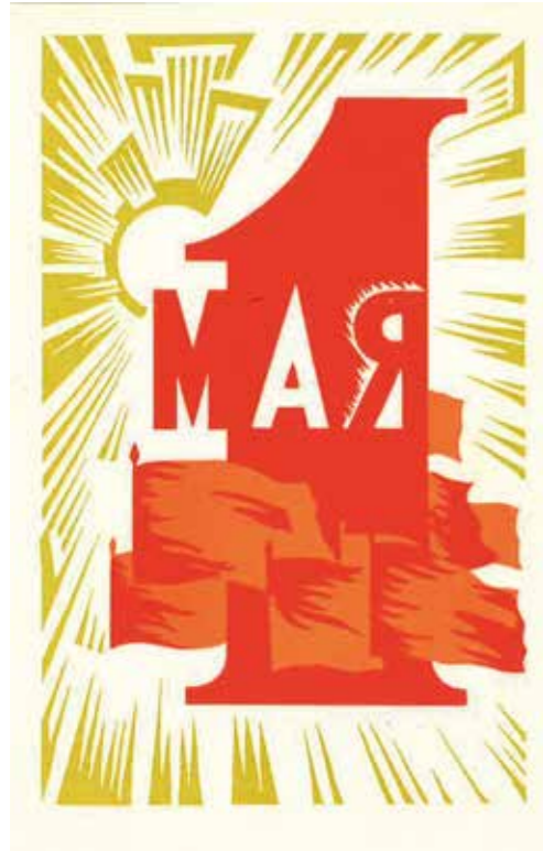
1.Mai“, Moskau 1969 (Archiv der sozialen Bewegungen);