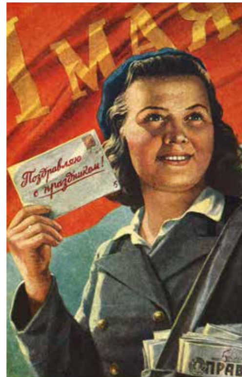
„1.Mai – Grüße zum Feiertag!“ Moskau, 1958