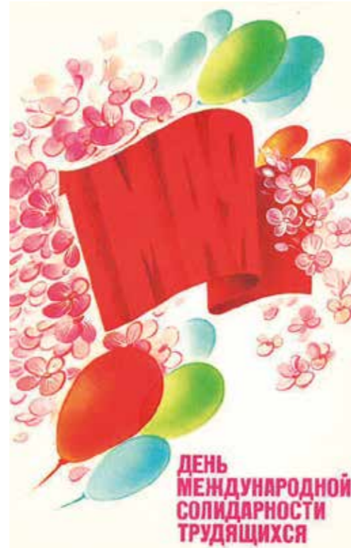
1.Mai – Tag der internationalen Solidarität der Werkstätigen“, Moskau, 1985