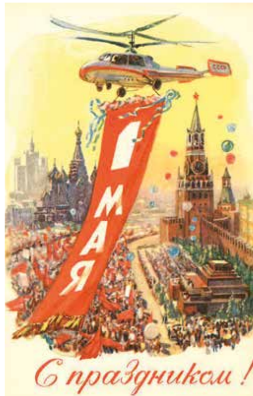
1.Mai – Zum Feiertag!“ Moskau, 1962