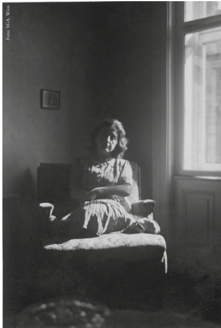
Rosa Jochmann 1945, unmittelbar nach ihrer Rückkehr aus Ravensbrück

Immer eisiger wurde die Kälte. Wurde dieser Ort auch deshalb für uns als Wohnstätte ausgewählt, weil es da auch bei hellstem Sonnenschein keine Wärme gab? Jedenfalls war im Zellenbau der unerträglichste Geselle des Hungers die Kälte, die unfäßbare, nicht zu schildernde Kälte. Zuerst muß man sich an den Gedanken gewöhnen, daß man im Bunker ist, in jenem Bau, der von Frauen des Lagers aufgebaut wurde, dessen Herstellung Unzähligen das Leben kostete, dessen Boden gedüngt war mit den Tränen der Unglücklichen, die zu dieser schweren Arbeit beordert waren. Man muß sich daran gewöhnen, daß man als Sehender – zur Blindheit verurteilt ist. Monatelang! Man muß mit den Fingern die Augenlider befühlen, um zu wissen, ob man die Augen geschlossen hält oder ob sie offen sind. Denn die Dunkelheit hat jedes Empfinden dafür getötet. Man möchte sich wehren gegen diese Finsternis, die wie ein schweres Tier auf dir liegt, und doch unterliegt man ihr. Es ist so, als ob Zentner für Zentner auf dich geladen würden, immer mehr und mehr, und du bekommst das Gefühl, als ob du plötzlich erdrückt werden würdest von der Schwere des Daseins. Am Anfang versuchst du, gegen all diese Dinge zu kämpfen, du wanderst stunden- und tagelang ununterbrochen in der Zelle auf und ab, du horchst entsetzt auf die Geräusche, auf die entsetzliche „Symphonie“ des Bunkers. Du