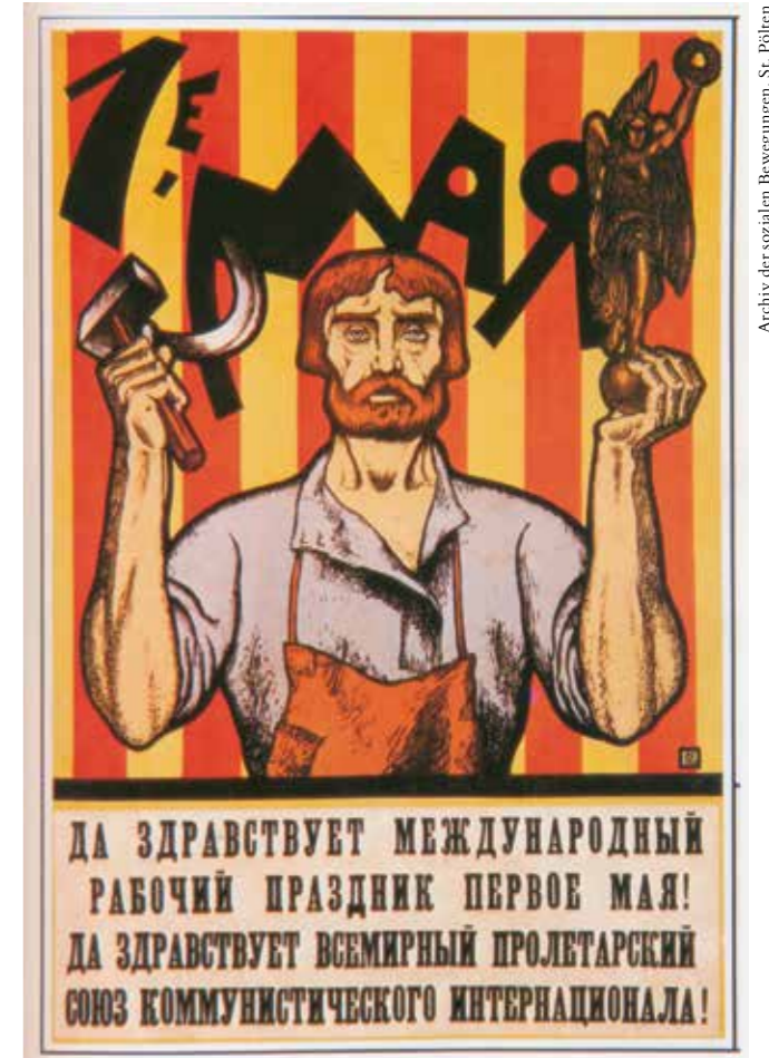
Plakat zur 1. Mai-Feier 1921. Im Mittelpunkt steht das neue Selbstbewusstsein der Arbeiterschaft als die herrschende Klasse im noch jungen Sowjetrußland.

Die Vorbereitungen für den Feiertag in Budapest begannen bereits kurz nach der Machtübernahme. Die Strassen der ungarischen Hauptstadt sollten in neuem, revolutionärem, Glanz erscheinen. Hierzu beschloss die Regierung sämtliche