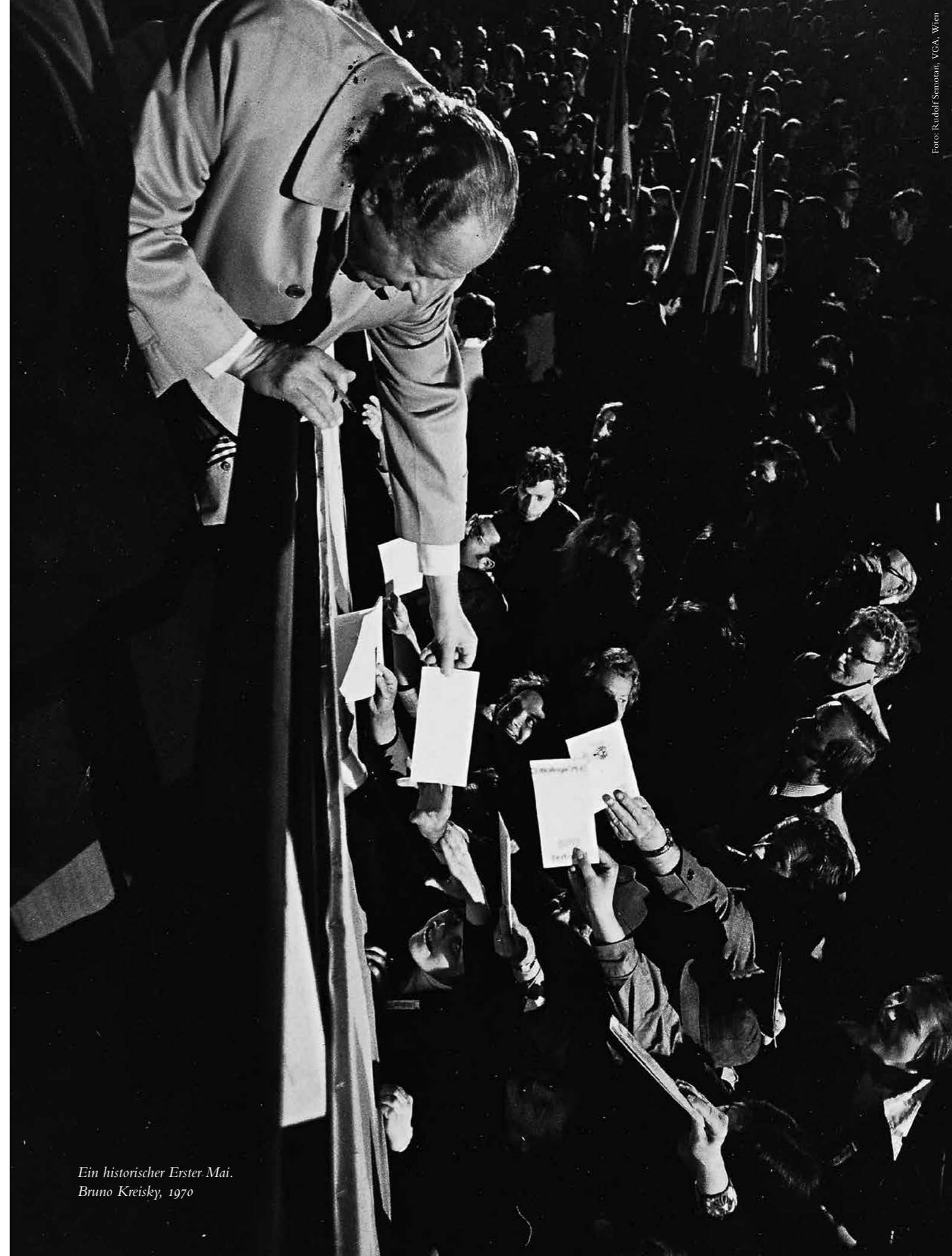
Ein historischer Erster Mai. Bruno Kreisky, 1970

Der Maiaufruf der Sozialistischen Partei Österreichs zum 1. Mai 1970, 25 Jahre nach Wiedergründung der Republik, spiegelte einerseits den Dank an jene Männer und Frauen wider die ihr Leben für die Wiederauferstehung der Republik gegeben hatten aber auch an jene, die mit Karl Renner die Freiheit und Unabhängigkeit Österreichs proklamiert hatten. Dann ging der Aufruf auf die aktuelle Situation ein und begründete die Haltung der Sozialdemokratie erstmals in der 2. Republik eine Minderheitsregierung zu bilden. „Damit feiern wir zum ersten Mal seit 1945 einen 1. Mai unter einem Bundeskanzler aus den Reihen der Sozialdemokratie. „Die Hoffnung von hunderttausenden demokratischen Sozialisten in unserem Lande, der Wunsch von 2 ¼ Millionen Wählern und Wählerinnen ist damit in Erfüllung gegangen“.